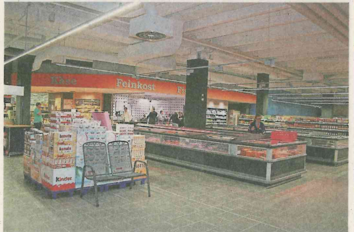
Sehr großzügig und übersichtlich präsentiert sich die neue Frische-Abteilung im SBK.